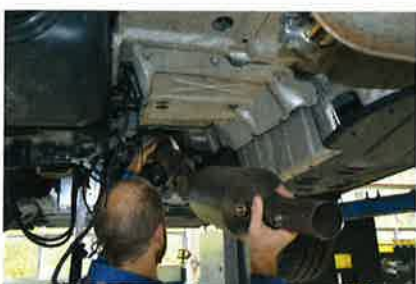
Der Abgasstrang mit SCR-Kat ersetzt passgenau das Abgasrohr des T5 bis zum Mitteltopf.