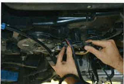
Pumpe und Heizung des Tanks sowie diverse Sensoren müssen angeschlossen werden.