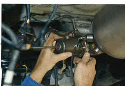
Nach Montage müssen NH 3 -Generator und AdBlue-Injektor angebracht werden.