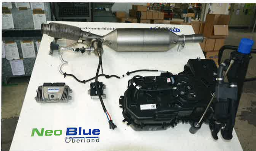
Baukasten-Set: SCR-Katalysator mit Einspritzsystem, AdBlue-Tank und das passende Steuergerät.

Als Nächstes werden Heizung und Pumpe des AdBlue-Tanks an das Steuergerät angeschlossen. Dann folgt der Einbau der AdBlue-Förderleitung zum NH 3 -Generator, die ebenfalls beheizt ist. Zu guter Letzt wird auch die Heizung der AdBlue-Förderleitung angeschlossen. Als Nächstes erfolgt der Einbau des SCR-Katalysators. Dafür muss zunächst das Abgasrohr mit Flexrohr hinter dem Partikelfilter bis vor den Mittelschalldämpfer durch Lösen der Schellen entfernt werden.