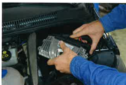
Das eigens entwickelte Steuergerät sorgt für die korrekte Dosierung im SCR-Katalysator.