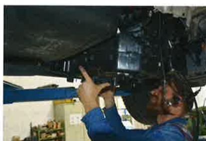
Der AdBlue-Tank des T6 passt auch in den T5 – mit leichten Modifikationen an der Halterung.